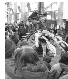
L'île aux machines