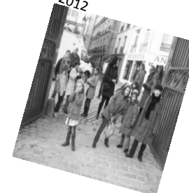
Saveurs de mômes