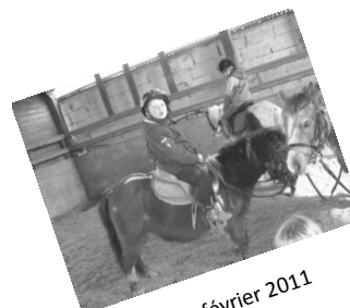
Poney février 2011